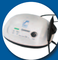
Ablatore piezoelettrico Foschi Ensodent