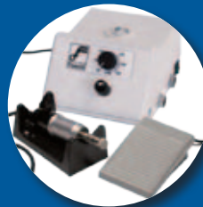
Micromotore Foschi con manipoło professionale