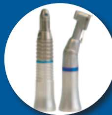
Inserto manipoło Intramatic contrangolo standard